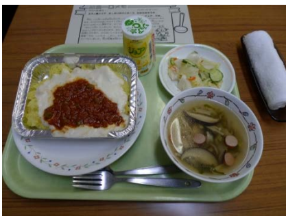
きのこをたっぷり使った給食