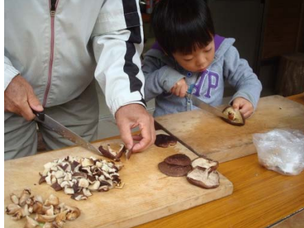
参加者による乾しいたけの準備