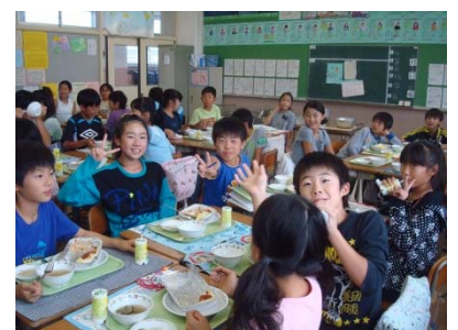
美味しく食べている給食の様子