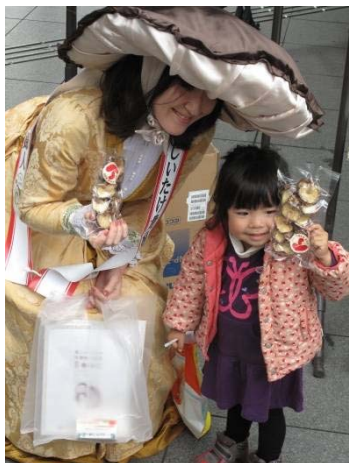
乾しいたけ貴婦人による配布