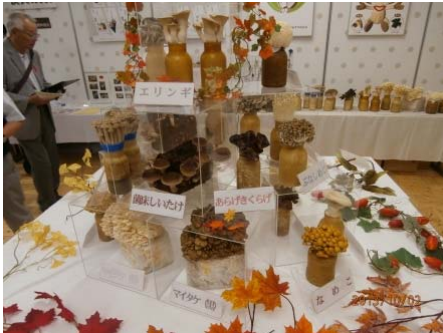
12種類のきのこを展示