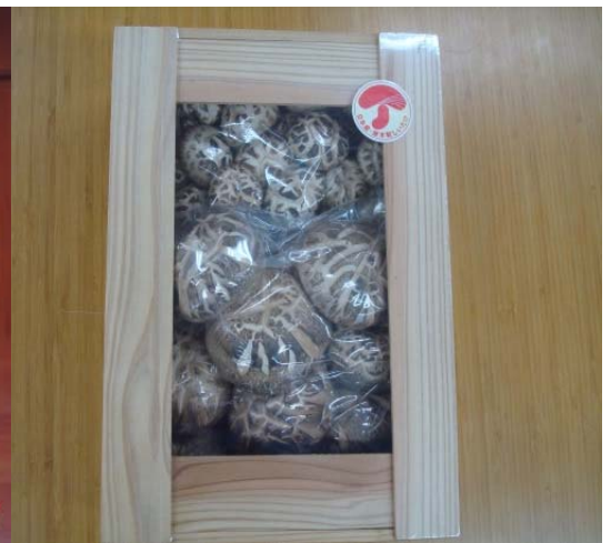
乃木坂46が林農林水産大臣表敬訪問(中央右大臣、左林野庁長官)と贈られた乾しいたけ