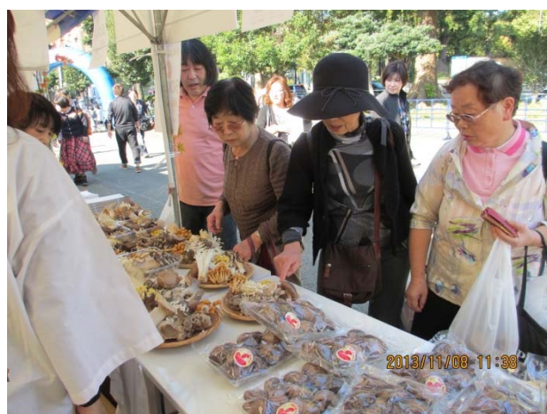
9種類のきのここと乾しいたけ等を販売