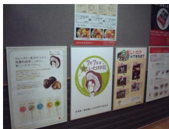
乾しいたけのPRパネル