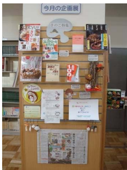
企画展示：料理、歴史等の著書