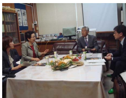
座談会「きのこの学校給食での利用」