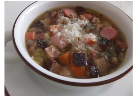
乾しいたけと野菜のミネストローネ