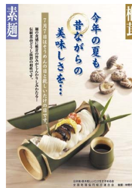
ポスター 7月7日は「乾しいたけ」の日