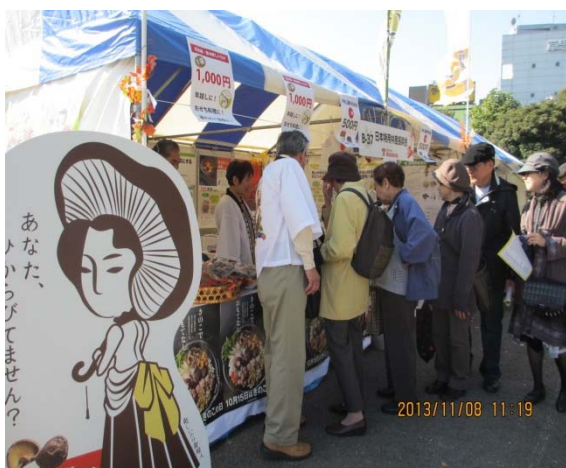
生鮮きのこ、乾しいたけ、炭等ブース