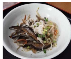
かにかまの旨塩炒め