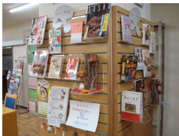
企画展示著書とともに、「乾しいたけの日」、「きのこの日」等をPR